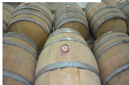
Borovitsa ボロヴィッツァ村